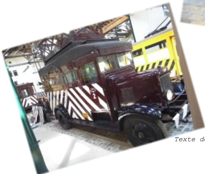
Texte de J-F Magnée, photos de Patrick Despotin dit Pompom.