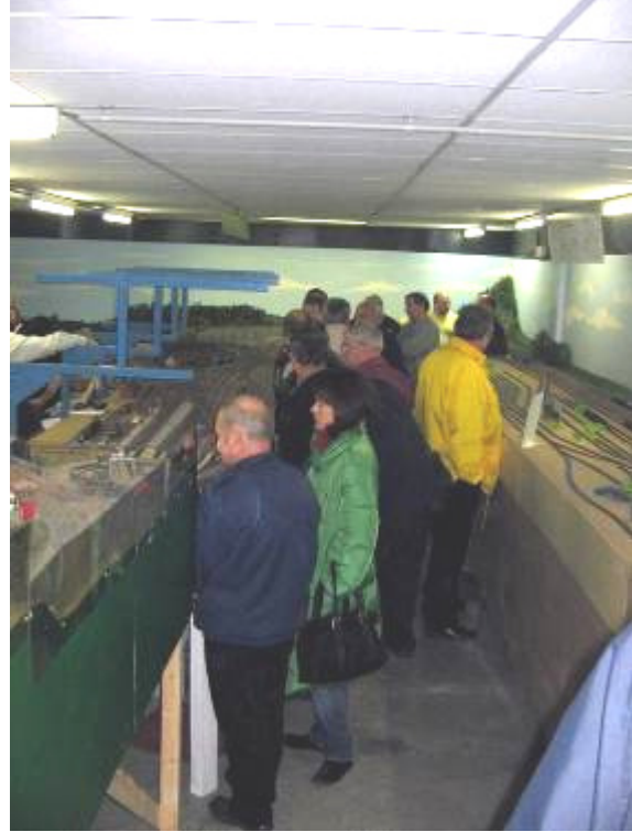
Les visiteurs admirent notre réseau