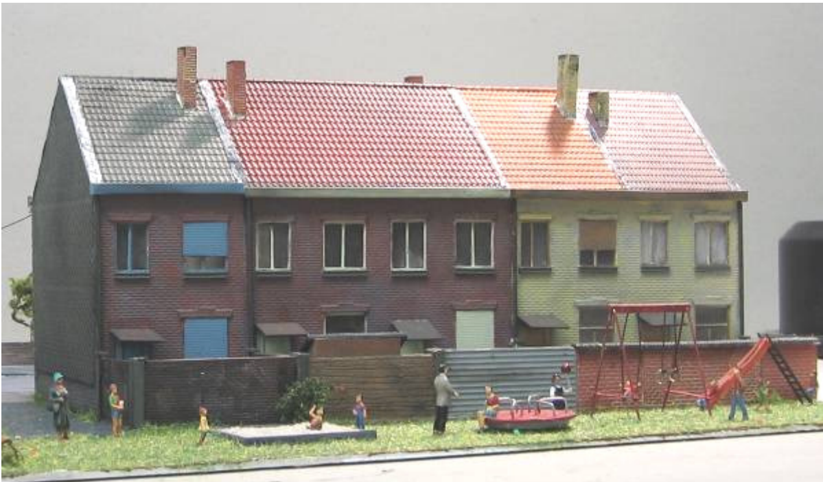
Une partie de la rue le long de la Meuse. Un mètre carré de bonheur